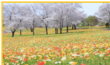
（春の八王子山公園）