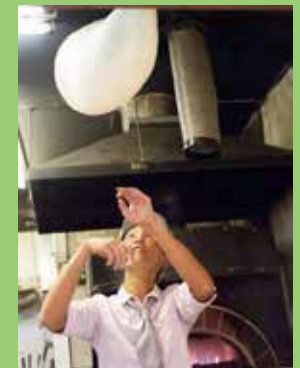
店長インタビュー

だんべーをもっとたくさんの人に知ってほしいと思います。予約もできるようになったし、どんどん使いやすくなっていると思います。イケメンや看板娘だけでなく、お店にポスター貼ったりしたいですね。