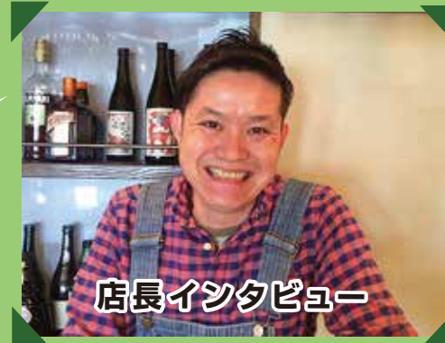
店長インタビュー

確実にランチに来てくれるお客さんが増えたね。集客は前の1.5倍!クーポンも使用してくれるお客様もいるから、だんべーからのお客さんだっすぐに分かるよ。