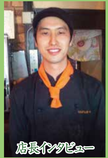
店長インタビュー

「お知らせ配信」です。 営業さんに言われて毎月変わるメ ニューを「お知らせ配信」するに したら、「お知らせにあった●●はあ りますか?」というお客様も増え ました。 また「先月と内容が変わったみた だから」とリピートしてくださる 方もいらっしゃいました。