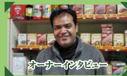
オーナーインタビュー

店内で食事をするお客様でもそうですが、やはり日本人のお客様が目に見えて増えたことです。正確に数をカウントしている訳ではありませんが、こちらも確実に2倍以上は増えたと思います。今までは日本人のお客様は数えるほどでしたので余計に実感します。ご来店頂いたお客様にそれとなく話を聞いてみると、だんべーに登録しているから安心して来店出来たという言葉聞いて、嬉しかったです。