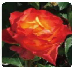
オレンジの グラデーションに!