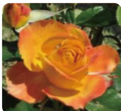
花が咲くと黄色から