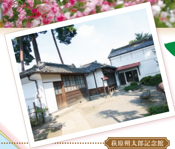
秋原朔太郎記念館

モダンローズ、オールドローズ、 イングリッシュローズ等、 約600種7,000株のバラと緑の芝生広場、 周囲の松林とが印象的な 美しいバラ園をお楽しみください。