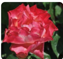
美しい赤へと 変化します