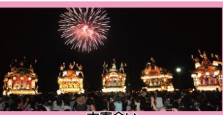
本祭り観覧席 19日 PM8:25~おまつり広場