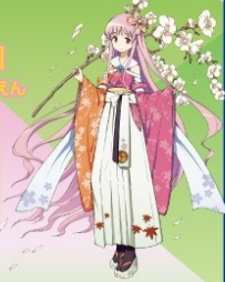
藤岡市観光協会 PRキャラクター「藤岡 桜ちゃん」

注意事項 ■ 規制車両は自転車を含む一切の車両です。 ■ 規制区域内にお住まいの方も車両は規制対象となりますのでご協力ください。 ■ ドローンは禁止と致します。 ■ 各無料駐車場には係員不在のため、自己責任でご利用ください。 ■ お煙草は、マップに記載された「指定喫煙所」をご利用ください、ご協力をお願いします